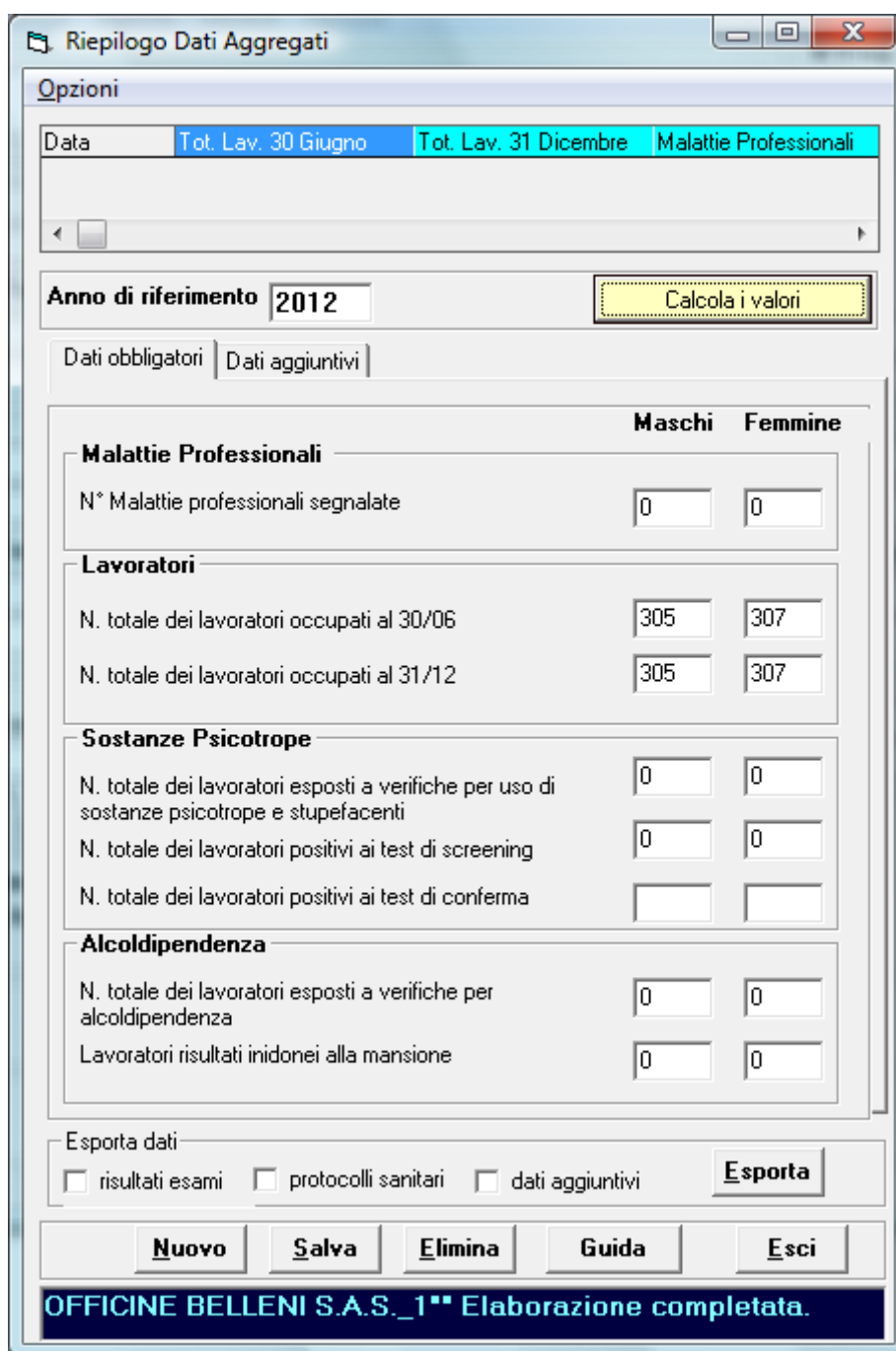
Fig.1 – Finestra di dialogo con il riepilogo dei dati aggregati e tasto per calcolo automatico. Si accede a questa finestra dalla anagrafica ditta, menu Esporta->Dati aggregati sanitari e di rischio.

Per l'invio dei dati all'INAIL, al momento di scrittura di questa guida (luglio 2013) non è stata messa a disposizione nessuna piattaforma da parte dell'INAIL che consenta l'invio automatico dei dati e quindi i dati proposti dal programma vanno copiati manualmente nella pagina di invio dati online.